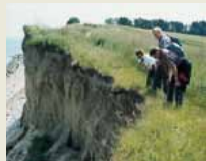
Kig ud over Nørreklint

Af hensyn til de ynglende tejster ved Nørreklint opfordres gæster til at benytte stien på toppen af klinten frem for stranden i perioden 15. april - 15. juli. Dette gælder også lystfiskere.