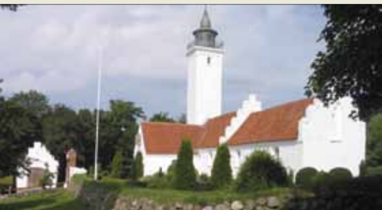
Tunø kirketårn fungerer som fyrtårn.