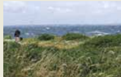
Tunø Knob med vindmølleparken

Ved Tunø Knob er der rejst en halv snes 63 m høje vindmøller. De udgør Danmarks første park af vindmøller anbragt i havet og blev rejst i 1995 som et forsøgsprojekt.