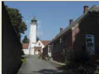
Tunø Kirke og Kro

Tunø har været beboet siden stenalderen, og kirken har med sin fine beliggenhed og sit specielle tårn, en kombination af kirke- og fyrtårn, stor historisk interesse. Man ved ikke, hvornår Tunø Kirke først blev opført. Kong Valdemar Sejr overdrog under et ophold i 1216 Tunø til Århus Domkirke, som tog initiativ til at opføre en kirke omkring år 1300. Selve koret tyder på at have dannet kirke tidligere. Der har senere været mange udvidelser og restaureringer. Især tårnet er blevet repareret mange gange, indtil man i slutningen af 1700-tallet ville rive det ned. Det blev dog i stedet overtaget af farvandsdirektoratet, som overtog forpligtelserne og forhøjede det til 18 m i 1801 samt indrettede det til fyrtårn med en flammehøjde på 31 m. Det er i dag muligt at komme op i tårnet, hvorfra der er en fantastisk panoramaudsigt. I klart vejr kan man se helt til Fynshoved med Storebæltsbroen i baggrunden.