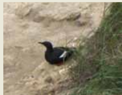
Tejsten - den sjældne alkefugl yngler på Tunø

I klinterne yngler store kolonier af digesvaler, strand-skader og stormmåger. Her finder vi også den 5. største koloni af den sjældne alkefugl tejsten, som kun yngler ca. 18 steder i Danmark. Af hensyn til de rugende fugle må man ikke færdes langs stranden ved klinterne i yngletiden. I vinterhalvåret ses også edderfugl, fløjlsand, hvinand, samt en lille bestand af ynglende toppet skallesluger. I farvandet omkring Tunø ses både spættet sæl og marsvin, som følger både Tunøfærgeren, sejlbåde, vinterbadere og de, der vandrer øen rundt.