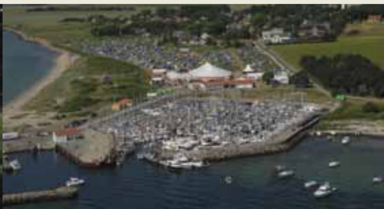
Den første uge i juli fyldes øen med festivalglade mennesker til årets Tunø Festival.