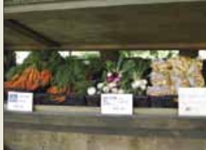
På Tunø får man friske grønsager

Efter lukning af øens mejeri i 1964 og slagteriet i Odder i 1987 er dyreholdet næsten ophørt. År 2007 kom der igen et større dyrehold på øen, nemlig 20 moderfår, så nu er man leveringsdygtige i "Tunølam". Ellers dyrker man hovedsageligt grønsager med porrer som største afgrøde, da klimaet giver optimale vilkår for grønsagsdyrkning. Men store arealer ligger dog udyrkede hen.