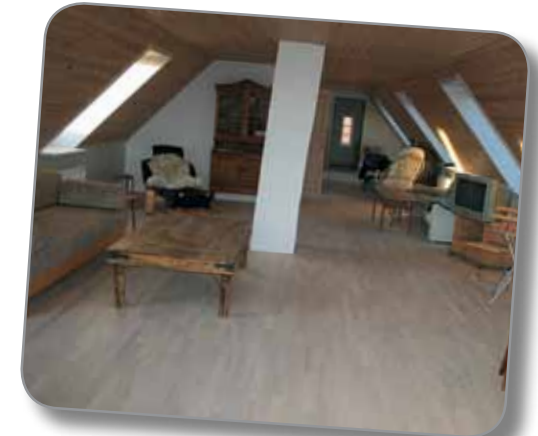
Der er plads til 6 personer i 1. sals lejligheden, hvortil der hører altan med god udsigt.