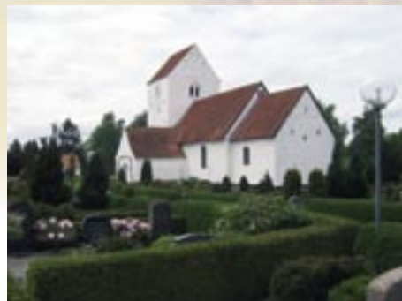
Den smukke, gamle kirke