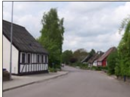
Der er mange gamle og velrenoverede huse i Søvind

Søvind har meget at byde på for den naturelskende familie.