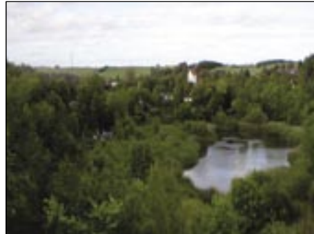
Natursti omkring den gamle mergelgrav. Borde og bænke i det fri. Længde 900 m