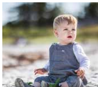
▲ For børn